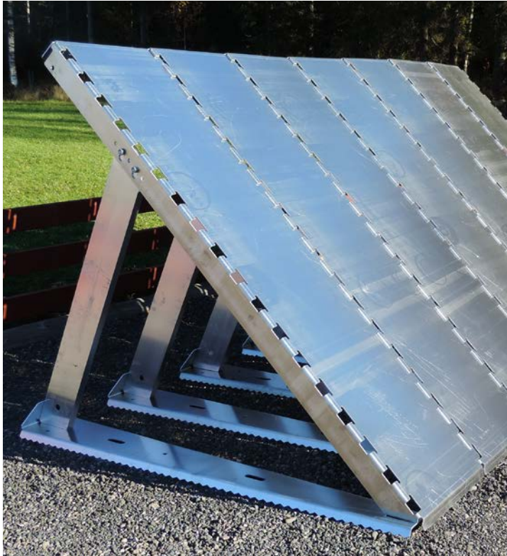
Obs! Fotot ovan visar den snarlika barriären H180