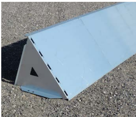
Bygg på med barriärsektioner