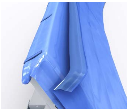
Fäst med clips