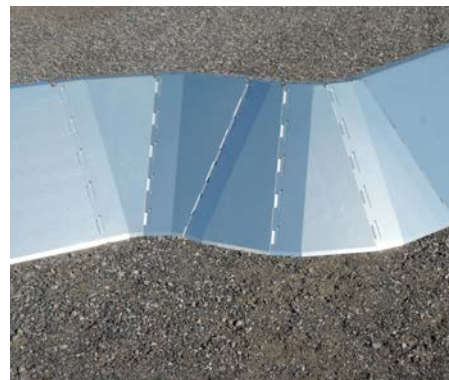
Hörnsektioner vid behov