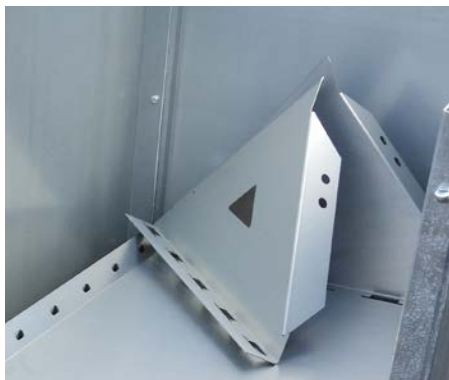
Börja med ändsektion